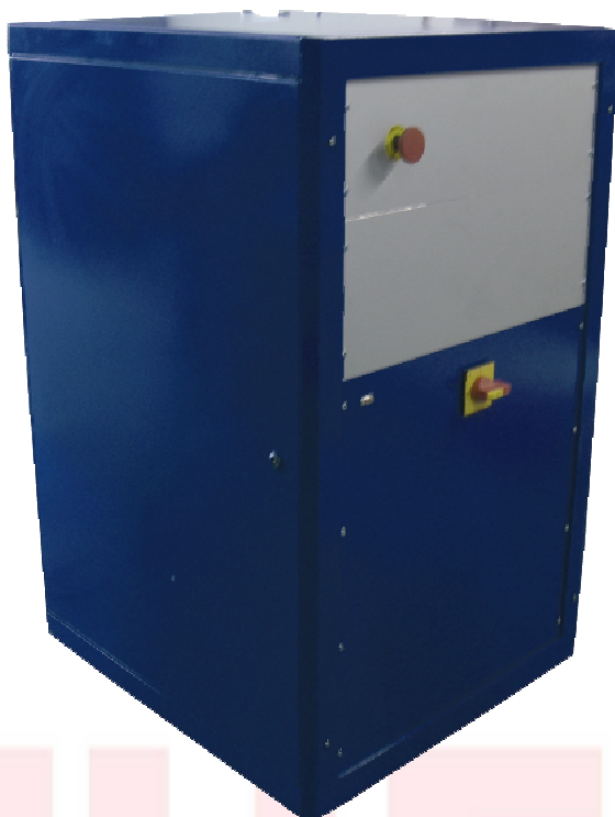
TNX 60 - 600

Es entfallen teure Zusatzkomponenten wie Temperatursauswertung, Master System, Überwachungseinheiten und Regelungseinrichtungen. Die in jedem Plustherm Generator integrierte TNX Steuerung übernimmt das komplette Controlling des Systems bzw. deren Umgebung. Dadurch ist ihr Projekt in Preis und Leistung skalierbar, und ermöglicht aufgrund der Flexibilität der TNX Steuerung eine zukunftssichere Lösung.