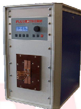
TNX 5 - 30